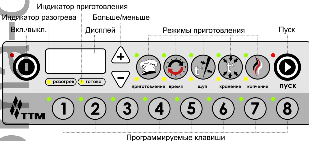
Рис. 2 Панель управления

Для включения печи необходимо подключить печь к электросети. При этом на дисплее появится надпись «OFF». На рисунке 2 показана панель управления печью.